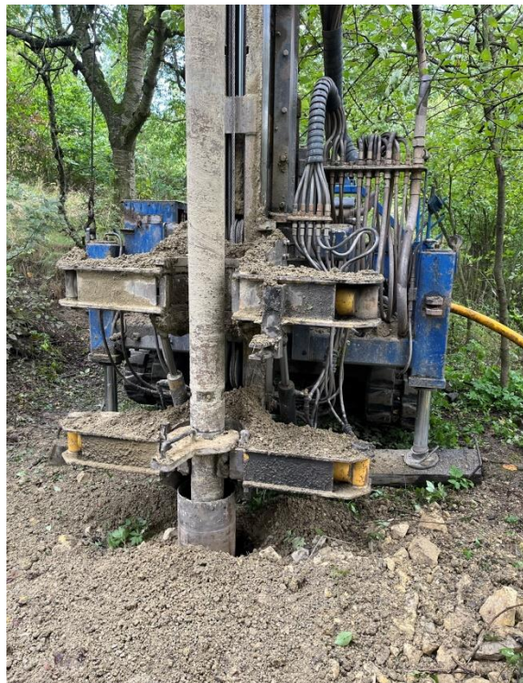
Vrtná souprava provádí odvrtání do hloubky 80 m, bylo prováděno dvěma dodavateli