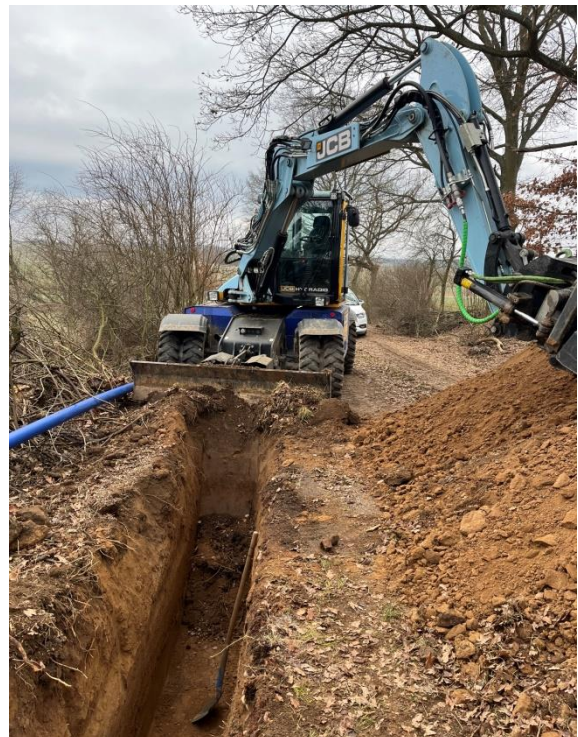
Pokládka vodovodního potrubí do otevřeného výkopu potrubí zapískované s položenou výstražnou fólií zemní práce pro výkopovou rýhu