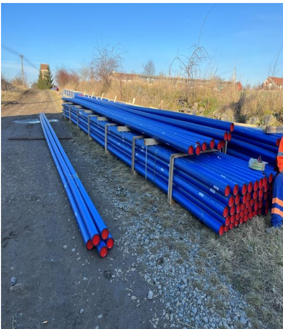
Dodávky stavebního materiálu plastové potrubí PE v tyčích