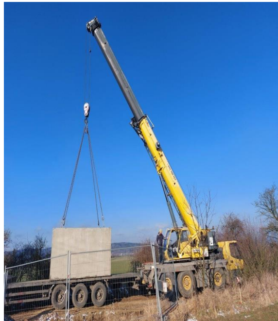
vykládka ŽB prefabrikované armaturní šachty