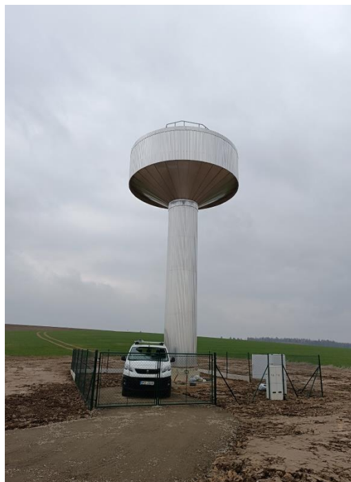
dokončený vodojem včetně oplocení