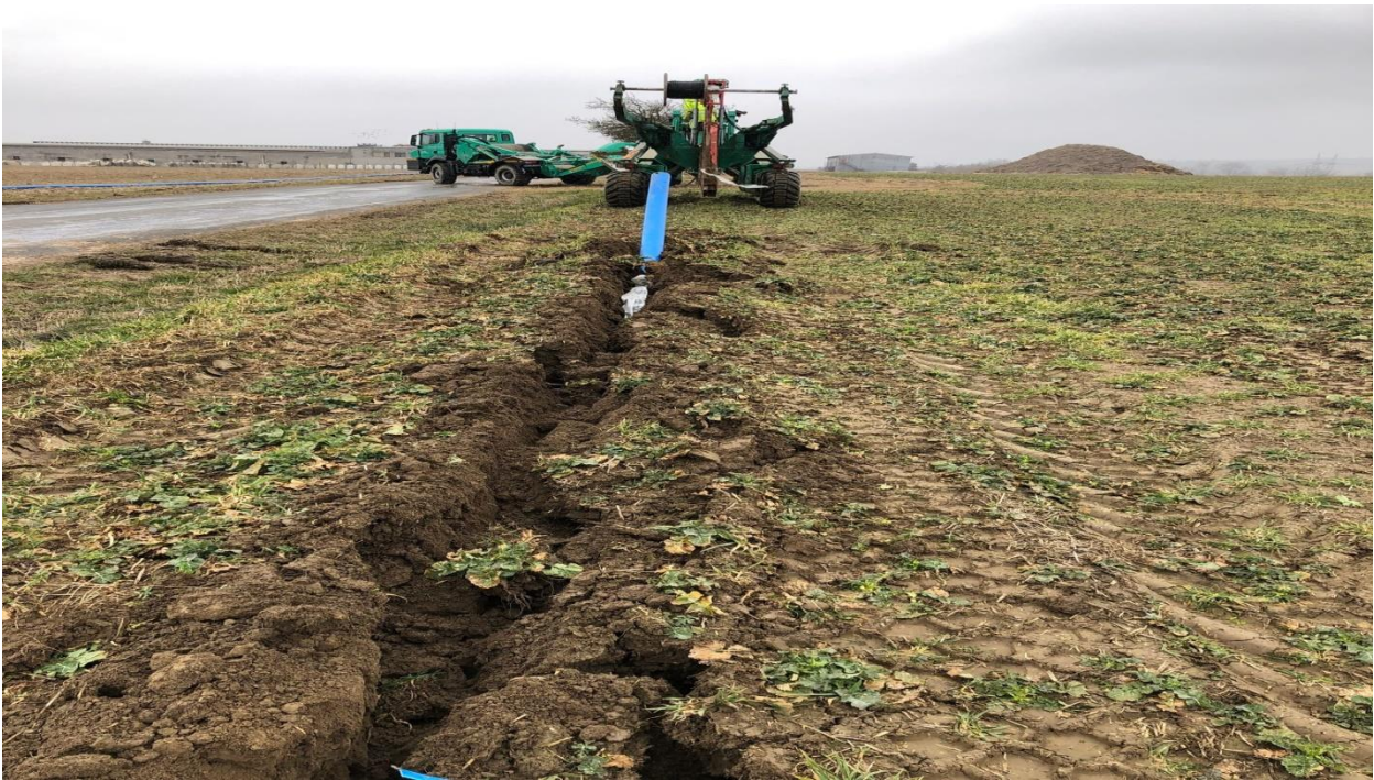
Pokládka vodovodního potrubí technologií pluhování