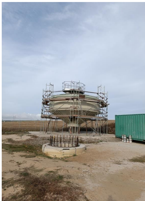
Výstavba věžového vodojemu Hvozd 100m3 nástřik barvy z lešení